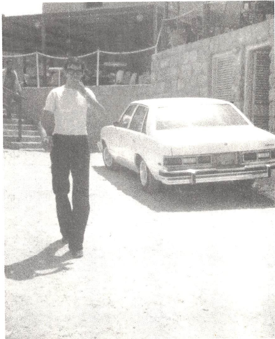
سيارتي بعد سرقة لوحتها المعدنية الخلفية في تل أبيب