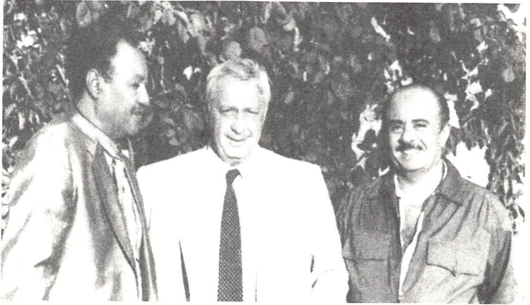
لقاء الرئيس جعفر نميري مع شارون برعاية رجل الأعمال السعودي عدنان خاشقجي بمنتجع كيلمنجارو في كينيا