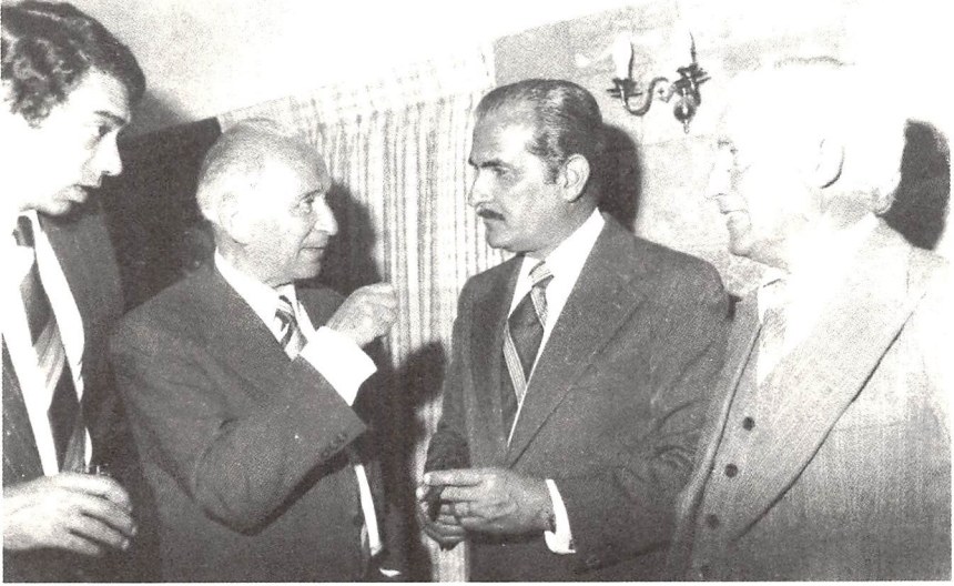
مع اللواء محسن حمدي في مباحثات التطبيع