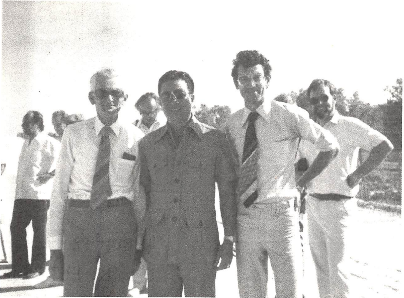
مع مجموعة من الدبلوماسيين في الجولان المحتل