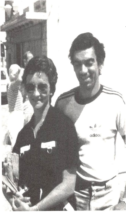
أنا ورونا أثناء الاحتفال بأعياد الميلاد في القدس